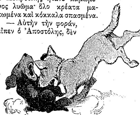
"Ἐχούθηκε ἀπάνω στὸν Ἀσπρούλη..."