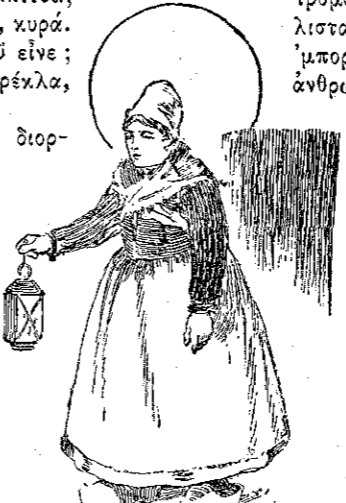
"Η Λεμονιά εἰσέρχεται μ' ἕνα...