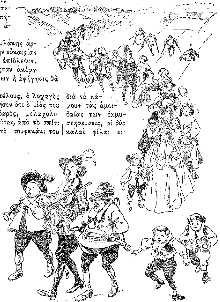
Ὁ γάμος ἐγένε μὲ μεγάλην πομπήν... (Σελ. 390 στ. 6')

Ὅσον ἐπερνοῦσαν τὰ χρόνια, τόσο ἡ Ροζέττα ἐγένετο κόρη μὲ ὅλες τὰς χάρες, καλὴ καὶ χαριτωμένη. Δὲν ἦτο ὅμως μόνη ἐκεῖ. Τὴν συναδευεν ἡ φιλενάδα της, ἡ Βαβίλδα. Καὶ διὰ τὴν μίαν καὶ διὰ τὴν ἄλλην, ὑπῆρχαν σχεδὸν γάμου εἰς τὸν ἀέρα, καὶ ἀκριβῶς,